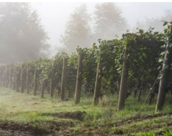
Vigneti alle Rocche di San Nicola a Novello

Per tre anni, sull'onda dell'entusiasmo, da queste vigne venne prodotto un vino denominato Langhe Doc rosso a base di uve Barbera. Manco a dirlo, il nome di quel vino era "Pemol" come riferimento alla zona e portava in etichetta l'impronta di un piede colorata di viola. Ma fu una scelta passeggera, abbandonata nel giro di pochi anni.