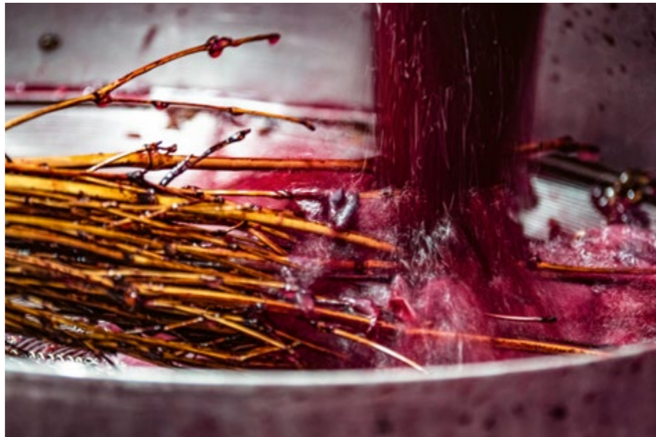
La svinatura del Nebbiolo da Barolo

Quando i tempi della vigna e della cantina sono conclusi inizia un'epoca nuova, altrettanto stimolante, quella del calice, della tavola, dell'incontro con il degustatore che rifiuta i conformismi e cerca le emozioni più vere. Nel calice, annota quel colore granato deciso e attraente che ricorda le ciliegie appena raccolte e che poco per volta si tinge di sottili riflessi arancioni. Nelle annate più fresche esibisce una grande raffinatezza di profumi, generosi ma un po' schivi; in quelle più calde e assolate, racconta la solennità e la prontezza. In ogni caso, i caratteri ripetono le loro note, che richiamano sentori floreali e fruttati e poi poco alla volta l'etereo avvolgente e le spezie più nobili. In bocca, dopo un primo passo un po' più titubante per via della sua gioventù,