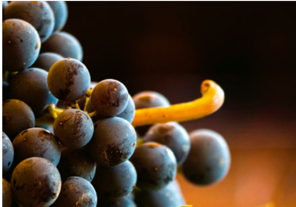
Acini e grappolo di Nebbiolo Talin

Su quell’appezzamento di terreno vennero messe a dimora 450 piante selvatiche di Vitis Rupestris e l’anno successivo – dopo la loro buona radicazione –