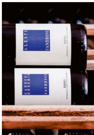
Il passaggio dal Barolo Cannubi Boschis al Barolo Aleste