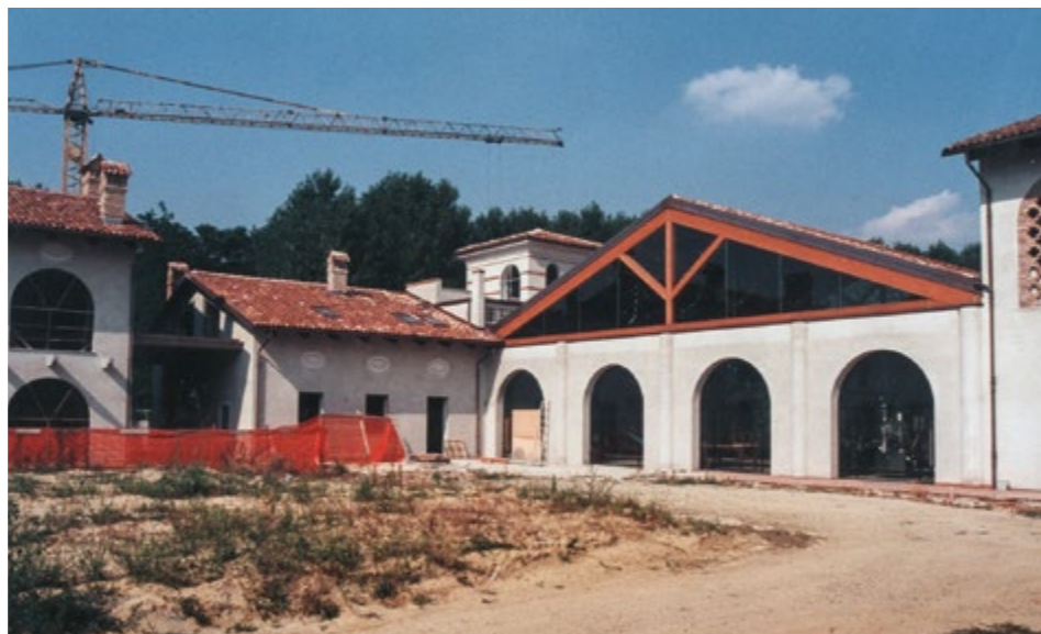
La costruzione della nuova cantina Sandrone