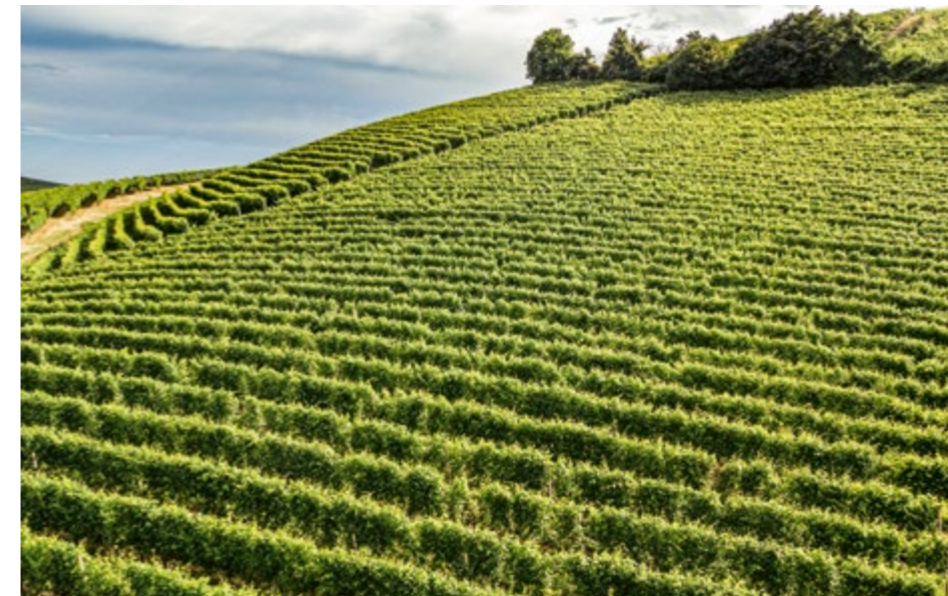
Vigneti assolati nei mesi estivi nella zona del Barolo

Annate calde nel corso del tempo si erano già verificate sulle colline di Langa e Roero. Molti ricordavano il 1997, che aveva stupito per l'imponenza delle strutture e gradazioni alcoliche al di sopra della norma. Ma il 2003 come annata meteorologica è stata davvero un'altra cosa e ha segnato nel tempo il cambio di atteggiamento che i viticoltori hanno dovuto tenere nel loro rapporto con il vigneto e la sua coltivazione. Il caldo record e la siccità sono stati i caratteri