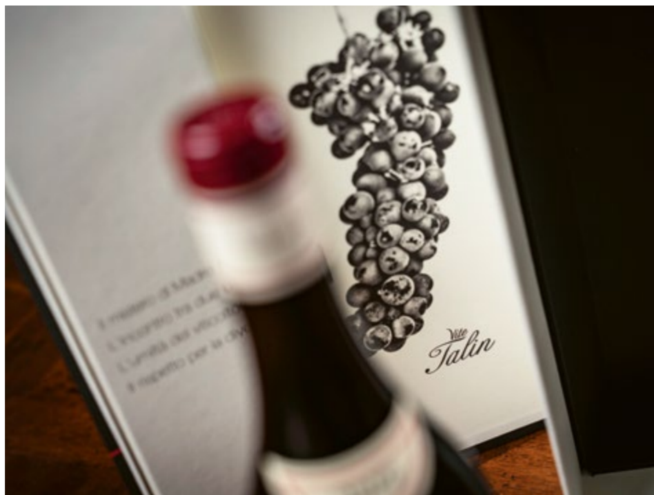
Barolo Vite Talin

Dopo tanto lavoro, con la realizzazione di nuove piante e nuove vigne, dopo che anche la sperimentazione in cantina aveva generato risultati pro-