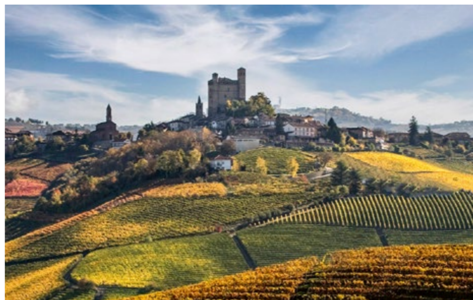
Colline vitate a Serralunga d'Alba

Finalmente, le “Menzioni” vennero introdotte nell'ordinamento legislativo italiano