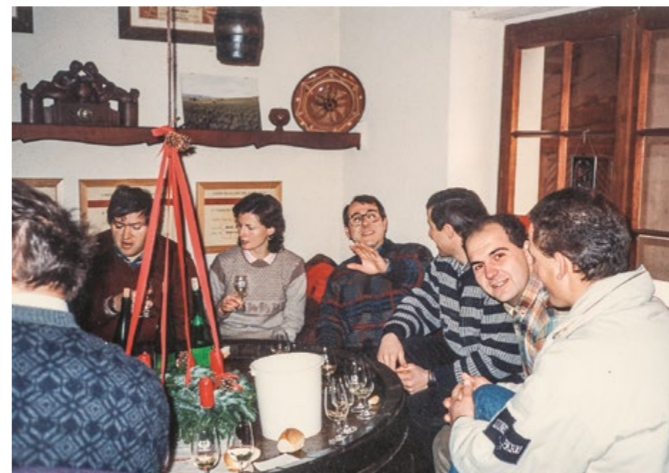
Il Natale e la sua festa