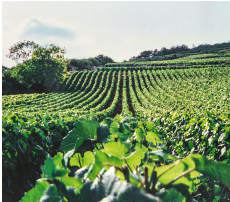
Vigneti a Montrachet in Borgogna