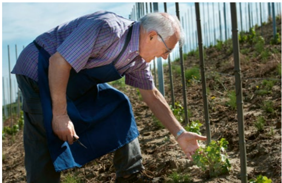
La cura delle barbatelle per il Barolo Vite Talin