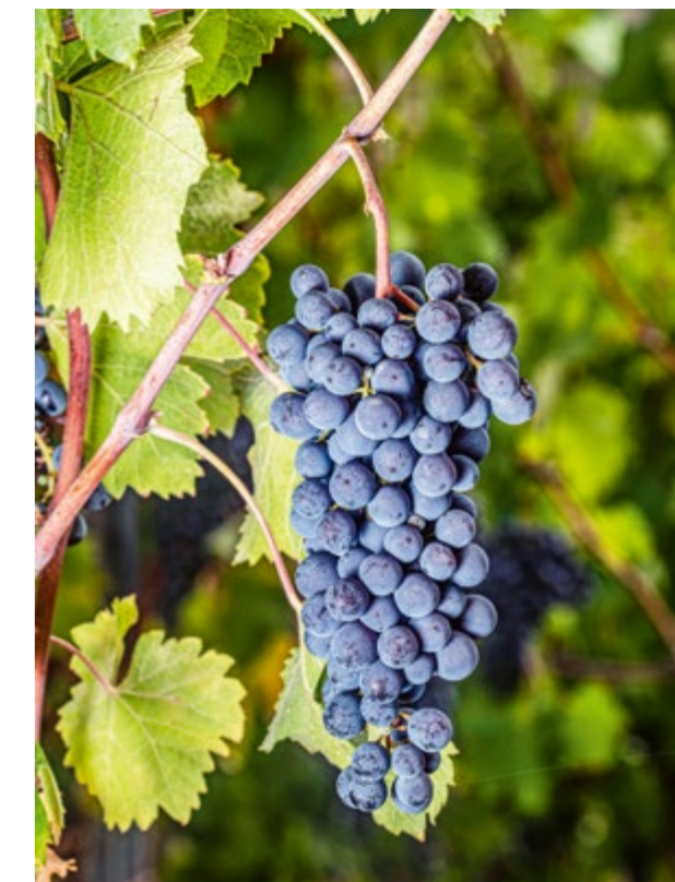
Grappolo di Nebbiolo Talin

Tassello importante è stato Vignane a Barolo, una Menzione Geografica Aggiuntiva che soprattutto negli ultimi 25-30 anni si è affermata per le sue