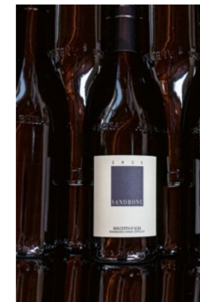
Dolcetto d'Alba, il vino della fragranza

La Barbera d'Alba Doc è un primo passo verso la fragranza affinata, quel complesso olfattivo e sapido che caratterizza i vini fruttati, in grado di di-