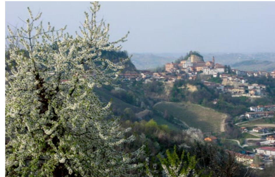
Il paese di Vezza d'Alba visto da Valmaggione