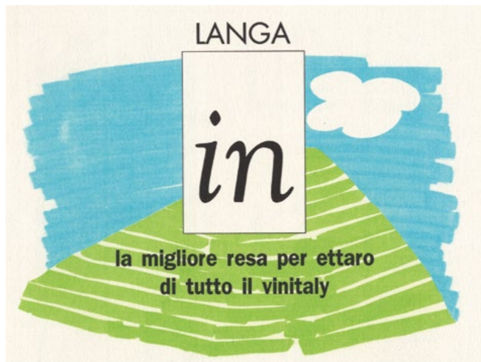
Il logo di “Langa In”

Non sappiamo se quegli incontri condotti presso la Confcoltivatori e la sinergia che poco per volta si consolidava tra questi piccoli produttori siano stati