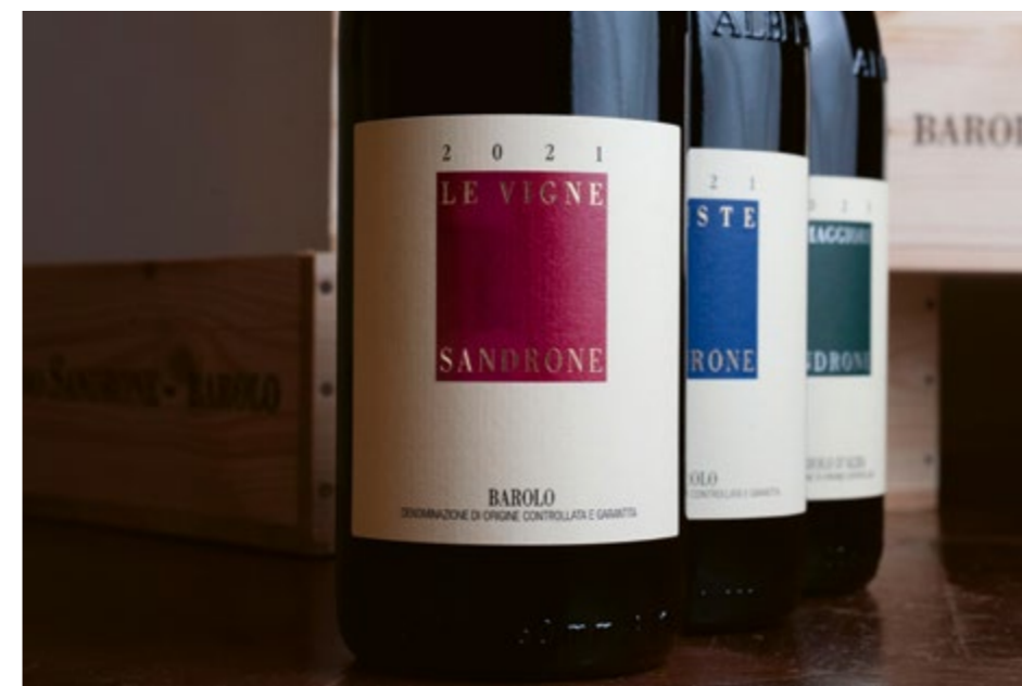
Le bottiglie dei vini Sandrone con la nuova etichetta