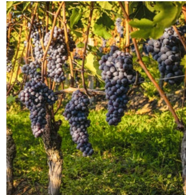
Grappoli di Nebbiolo verso la maturazione