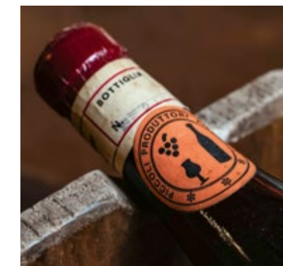
Logo dell'associazione Piccoli Produttori dei Grandi Vini del Piemonte