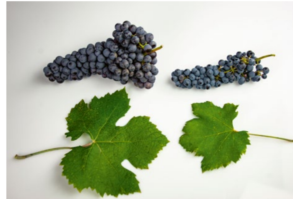
Tavola ampelografica del Nebbiolo Talin