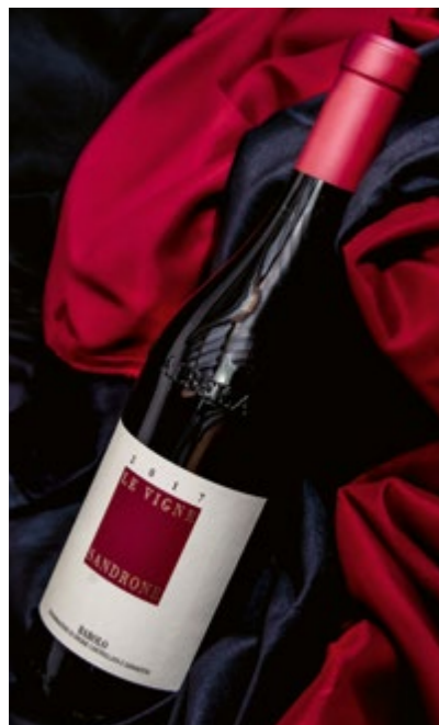
Barolo Le Vigne

Barolo Docg Le Vigne in ampi calici in compagnia dei piatti più apprezzati.