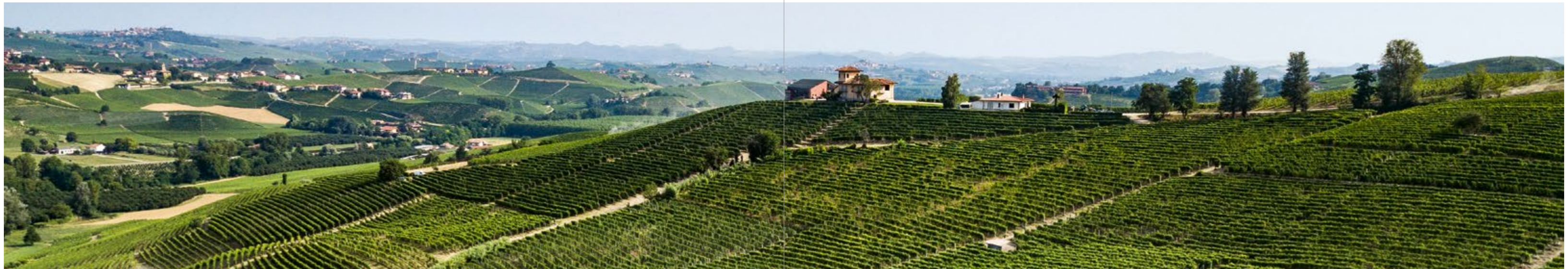
Vigneti di Nebbiolo a Castiglione Falletto nella MGA Villero

Baudana è una Menzione Geografica Aggiuntiva di Serralunga d'Alba, con inizio sulla dorsale collinare per scendere con esposizione sud e poi proseguire verso ovest, accarezzando tutto il crinale della collina. La parte più elevata della vigna Sandrone è quasi pianeggiante. Volendo essere più precisi assume una lieve pendenza in direzione ovest, nord-ovest, guardando il Rocciamelone con una visione a 270 gradi sull'intero arco alpino settentrionale, dal Bric Mindino fino al Monte Rosa, con focus sull'inconfondibile Monviso.