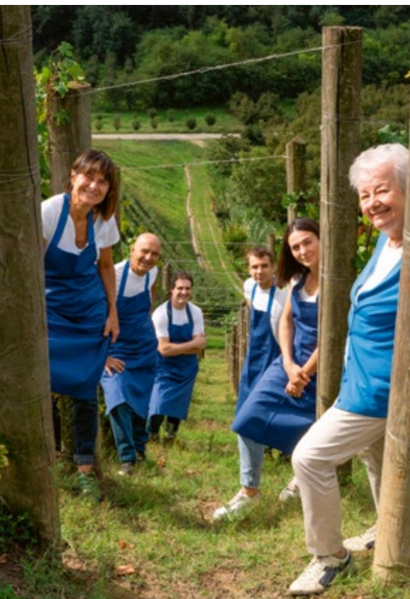
La verticalità del vigneto a Valmaggior