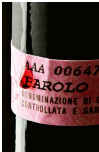
La fascetta ufficiale sul collo della bottiglia di Barolo

del Consorzio Barolo e Barbaresco e dei Comuni delle due aree di origine, vennero individuate, delimitate e ufficializzate le cosiddette “Menzioni Geografiche Aggiuntive”, siglate poi con l'acronimo MGA, quelle che la Francia tanti anni prima aveva definito “Cru”.