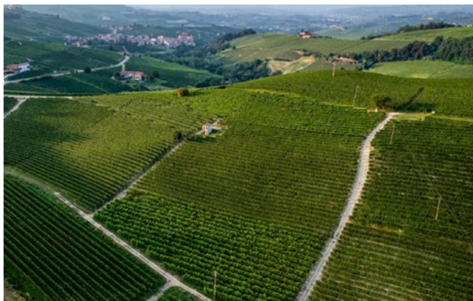
Vigneti nella MGA Ravera, tra Barolo e Novello

Restano da raccontare le vigne dedicate alla produzione del Nebbiolo d'Alba Doc Valmaggione e al Dolcetto d'Alba. Per ragioni diverse evitiamo di tornare su questi argomenti: per il Nebbiolo d'Alba il racconto si può rintracciare nel capitolo specifico dedicato agli Anni Novanta (vedi pagg. 82-86).