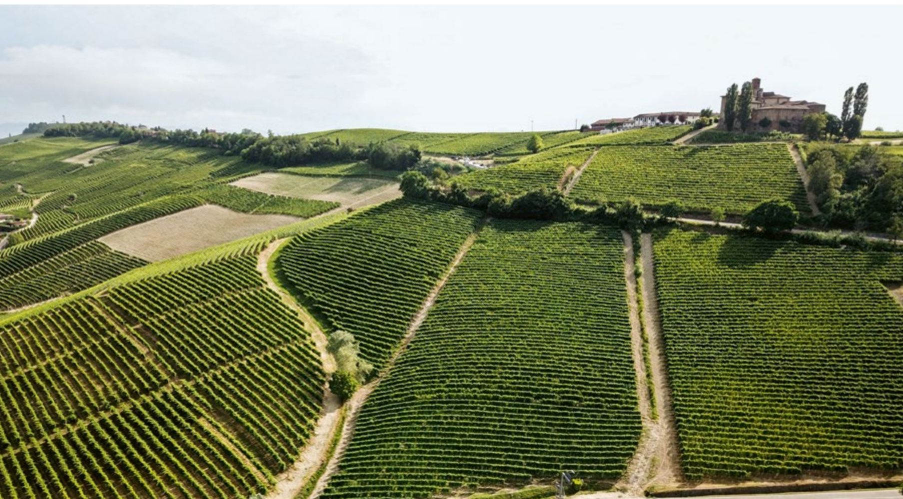
Vigneti di Nebbiolo Talin a Barolo nella MGA Drucà

Nel 2021, le prime piante risanate sono state messe a dimora in un campo sperimentale aziendale – per intenderci l’orto dietro casa – e nel 2024 le prime barbatelle innestate sono andate a dimora in vigneto.