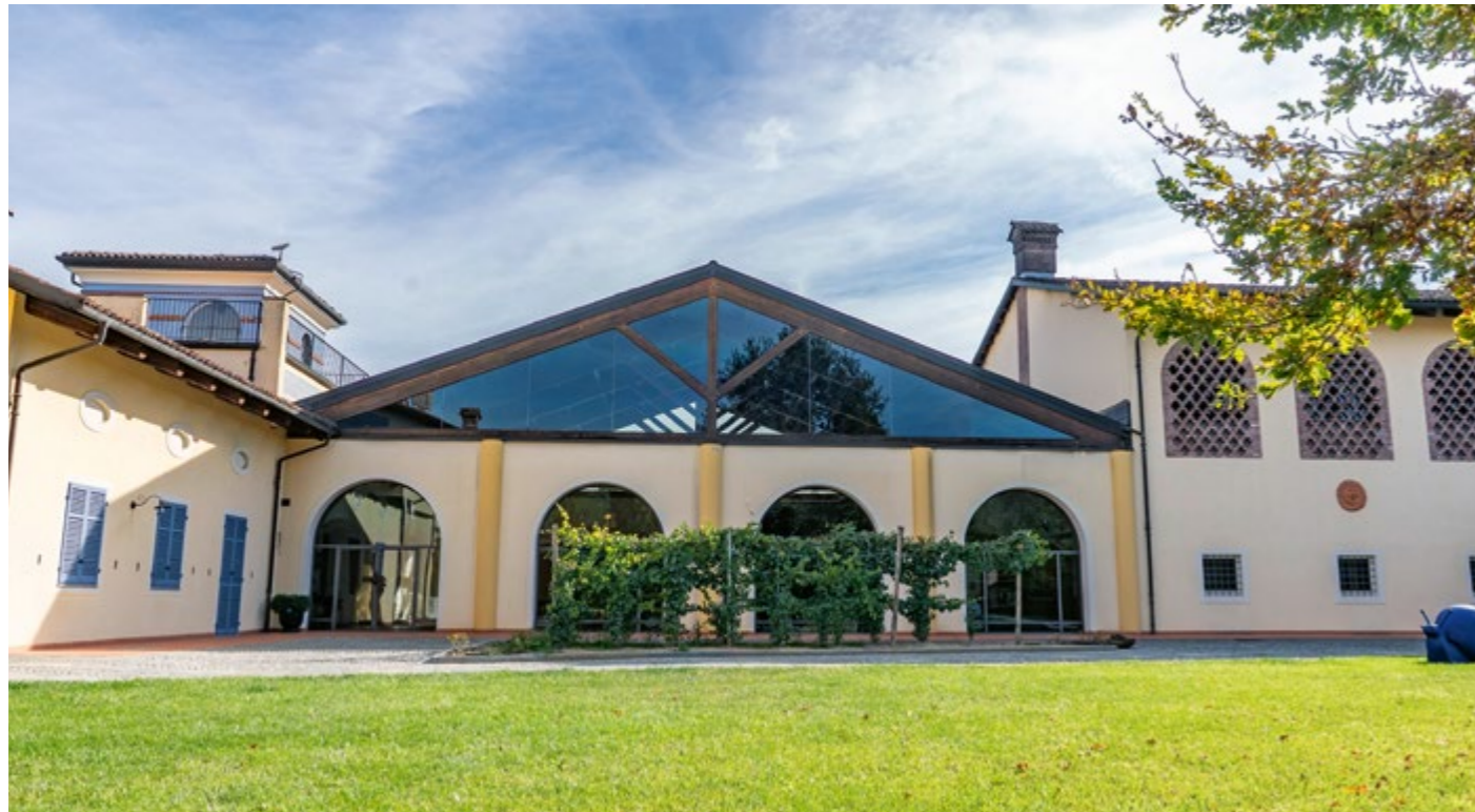
La nuova cantina Sandrone completata