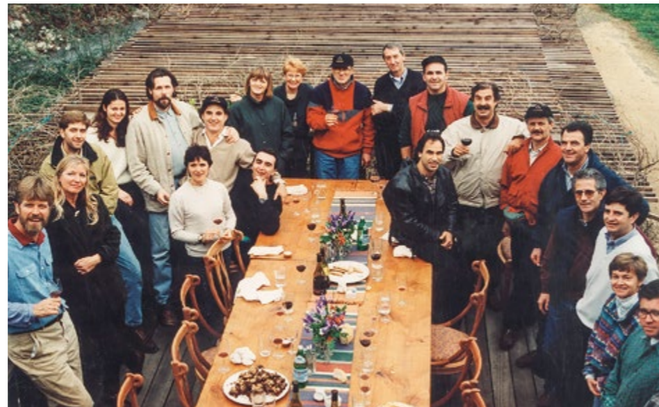
Delegazione di produttori di Langa negli USA