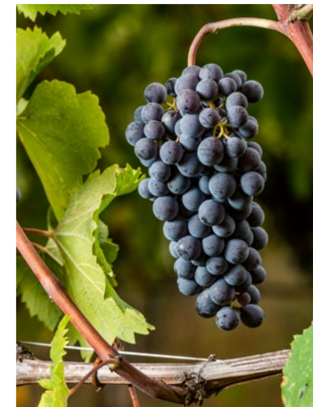
Grappolo spargolo di Nebbiolo Talin

Restava un problema: per saperne di più bisognava continuare e approfondire le indagini, ma in quel momento la Facoltà di Agraria e, in particolare, l'Istituto di viticoltura torinese non avevano le disponibilità, economiche e professionali, per portare avanti la ricerca.