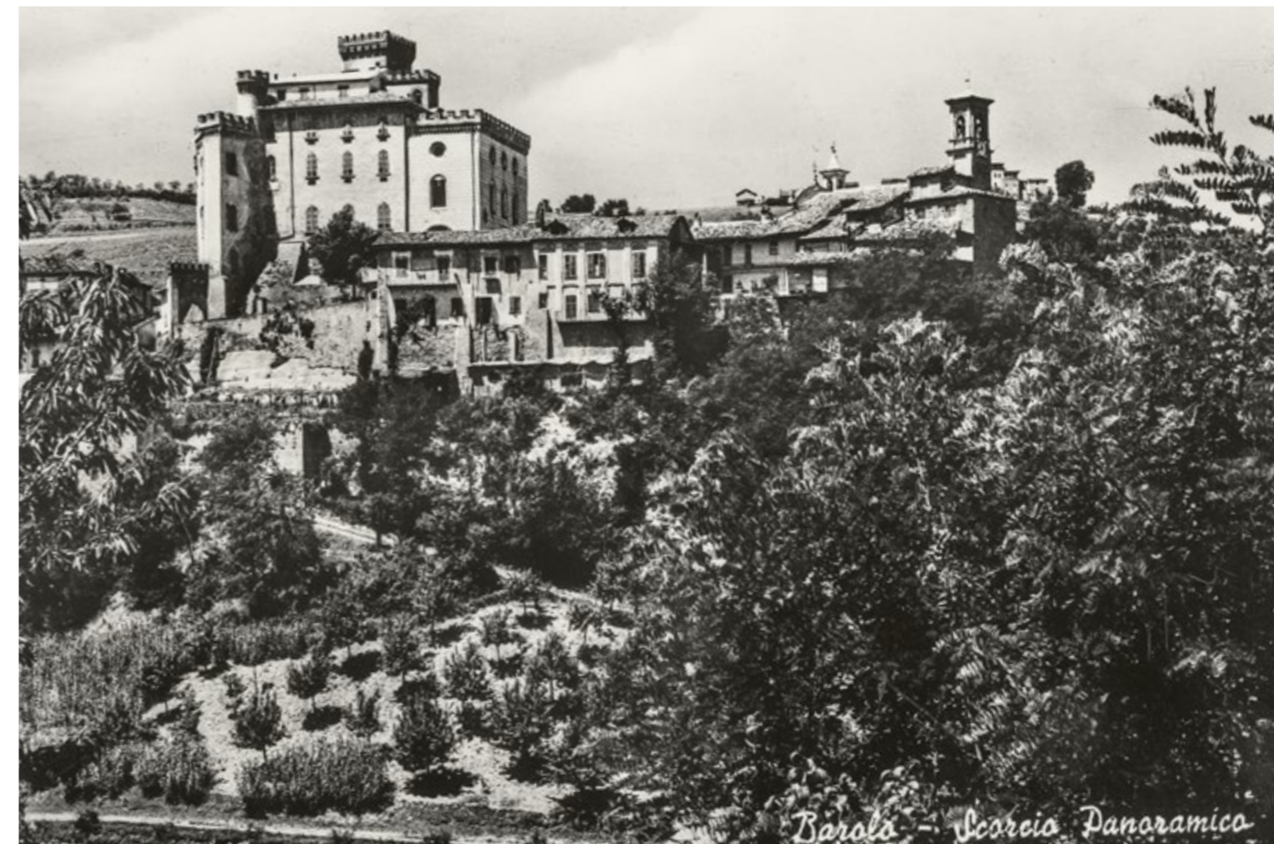
Barolo - Scorcio Panoramico

Vecchia foto panoramica del paese di Barolo