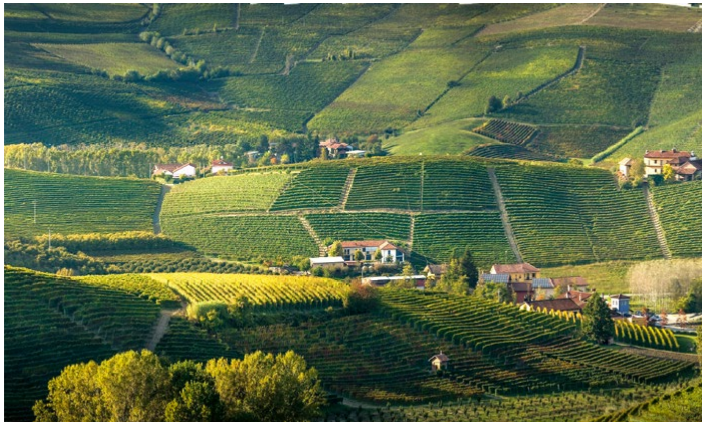
Vigneti a Cannubi Boschis, nel paese di Barolo