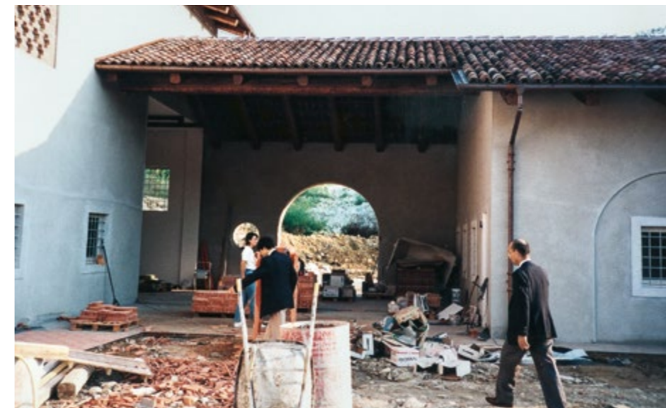
Altri lavori nella nuova cantina

Così, in fretta si resero conto che non avrebbero potuto accontentarsi di una piccola struttura, seppure impeccabile dal punto di vista tecnico e tecnologico.