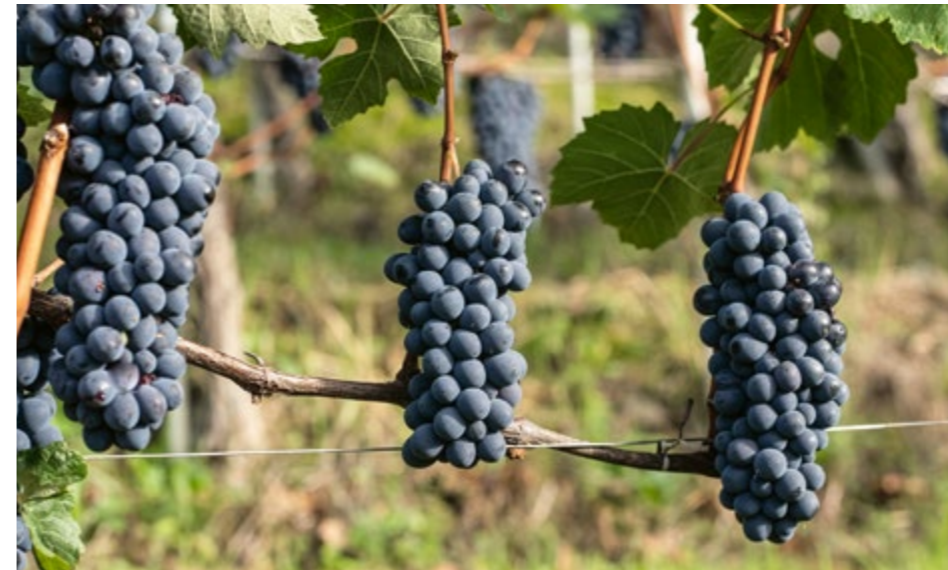
Grappoli di Barbera, nei vigneti di Novello

Nonostante la graduale riduzione della superficie vitata che ha caratterizzato negli ultimi decenni la viticoltura piemontese, il Barbera resta tuttora il vitigno più diffuso sulle colline di questa regione, favorito dalla sua spiccata capacità di adattarsi a vari tipi di terreno e di ambiente, dalla propensione a mantenere costante nel tempo i volumi produttivi e dalla sua indubbia duttilità nel comportamento produttivo, sia per generare vini giovani e di pronta beva, sia per dare vita a vini di struttura e spiccata longevità. Per questi suoi caratteri di piena generosità, il Barbera non ha frequentato soltanto le colline piemontesi, ma ne ha varcato i confini accomodandosi anche nell'Oltrepò Pavese, sui Colli Piacentini, su quelli di Parma e in parecchie contrade di altre