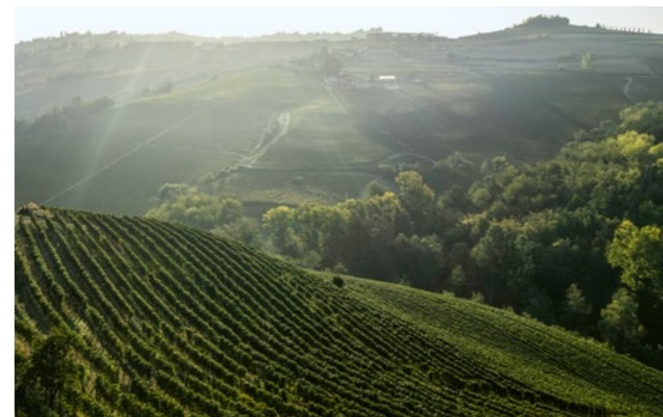
Vigneti nella MGA Le Coste di Monforte d'Alba