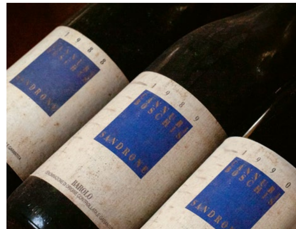
Tre annate storiche del Barolo

Il triennio 1988, 1989 e 1990 fu quello della definitiva consacrazione dei vini di Langa e Roero anche a livello internazionale. Dopo infinite discussioni, concreti progetti di valorizzazione e ulteriori approfondimenti conoscitivi, quelle tre annate di