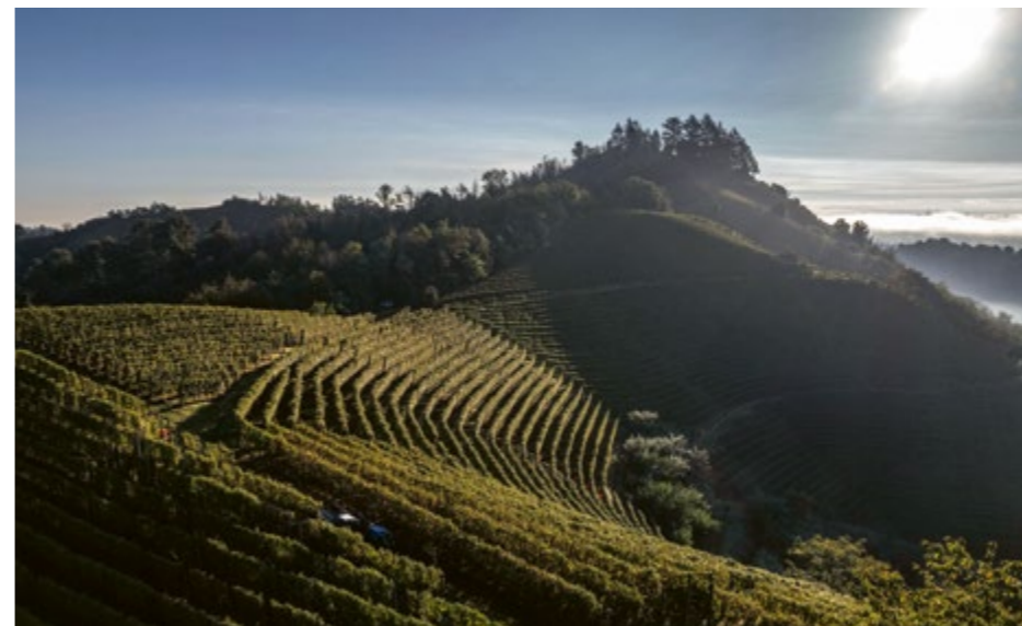
La cresta della collina di Valmaggiora

“Negli acquisti e nella selezione delle forniture, eravamo sempre insieme e giocavamo a essere soci. Lui era il buono della situazione e a me spettava il ruolo di duro, di rigoroso. Ci completavamo a vicenda. Ma aveva le sue strategie: nei rapporti con i fornitori come banche e assicurazioni preferiva incontrarli in azienda. Invece, quando voleva acquistare o affittare una vigna, allora andava a casa di chi vendeva perché in questo modo era lui che decideva quando alzarsi per lasciare la trattativa. E devo dire che la sua strategia ha sempre dato ottimi risultati. Così, abbiamo fatto insieme tutte le principali acquisizioni e per me è stata un'esperienza molto formativa”.