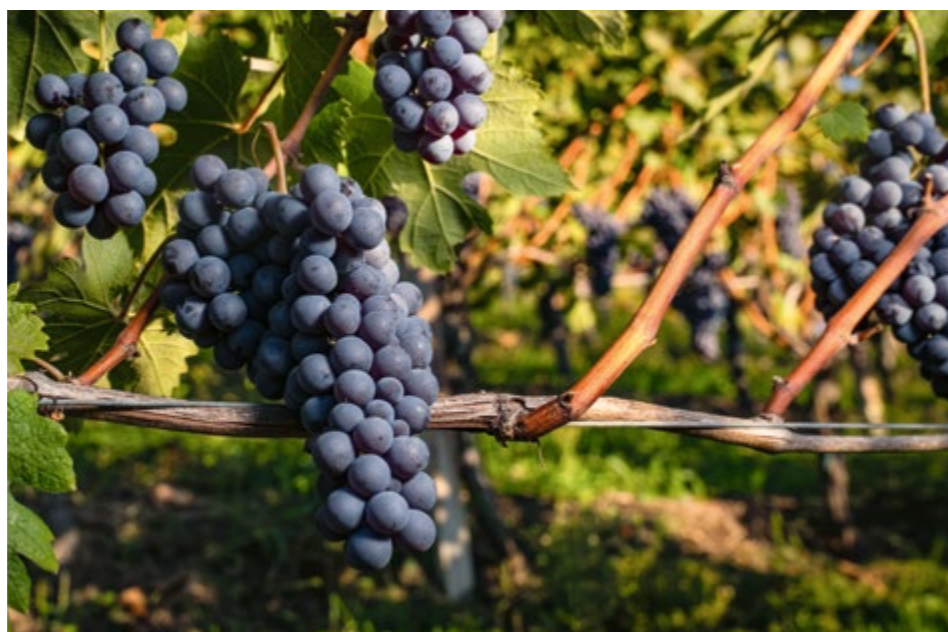
L'autunno regala la maturazione dei grappoli di Nebbiolo