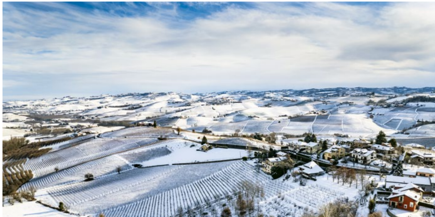
La lunga collina dei Cannubi sotto la neve

Tra queste anche Cannubi Boschis, la Menzione che contraddistinse uno dei vini Barolo di Luciano Sandrone. A queste si devono aggiungere anche le 11 di tipo comunale. Nella zona del Barbaresco, invece, le Menzioni delimitate furono 72. Di queste, furono 66 quelle recepite nel 2007 dal nuovo Disciplinare specifico.