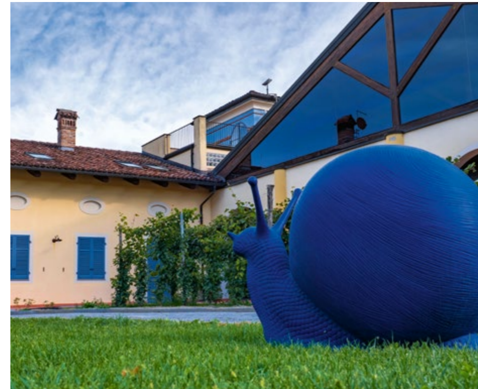
Un particolare della nuova cantina Sandrone