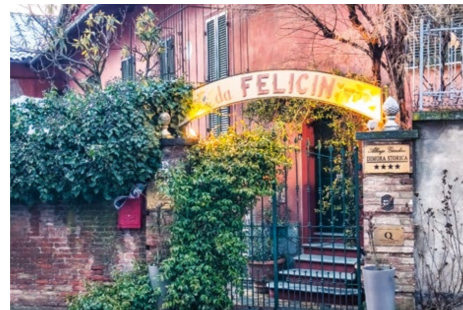
Ingresso dello storico Ristorante Felicin a Monforte d'Alba