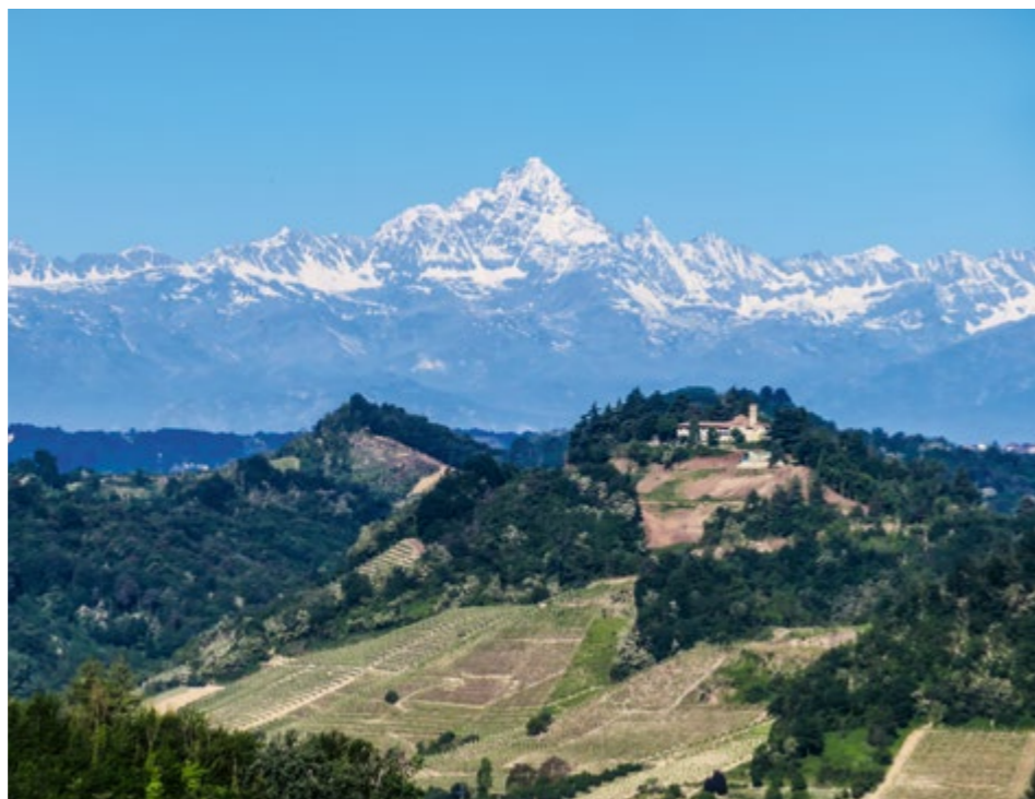
Il Santuario di Madonna dei Boschi con il Monviso sullo sfondo

Eppure, ancora adesso, percorrendone le vigne, camminandone i filari, si percepisce una sensazione di maestosità e di fascino che è difficile da ritrovare altrove. A dare una sensazione così speciale contribuisce da un lato la sua grande vocazione per la vigna, ma dall'altro anche la bellezza del paesaggio e la storia che questa porzione di territorio ha saputo sedimentare.