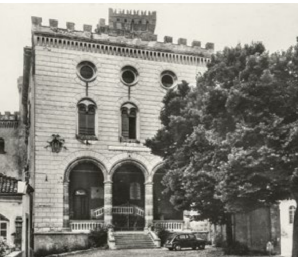
L'ingresso del Collegio nel Castello di Barolo