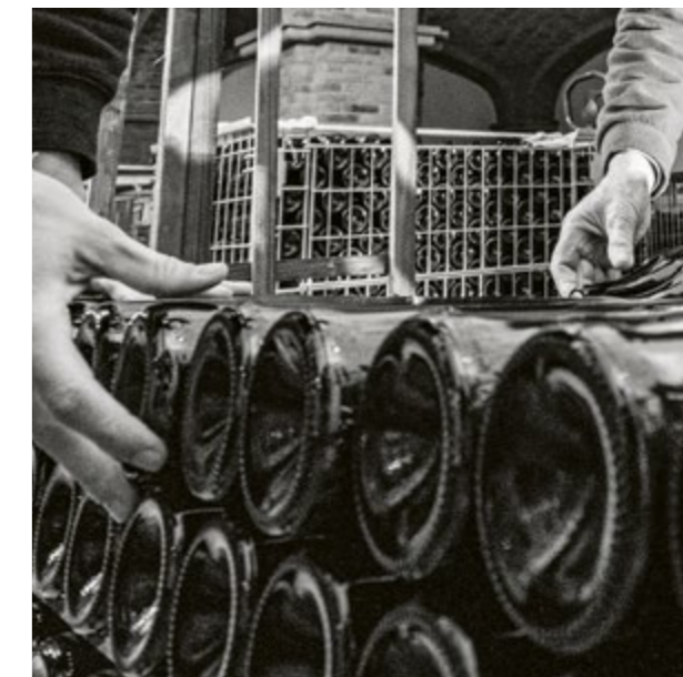
Bottiglie nude in affinamento in catasta