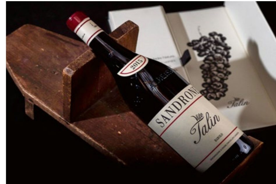
Il Barolo Vite Talin, il frutto della ricerca