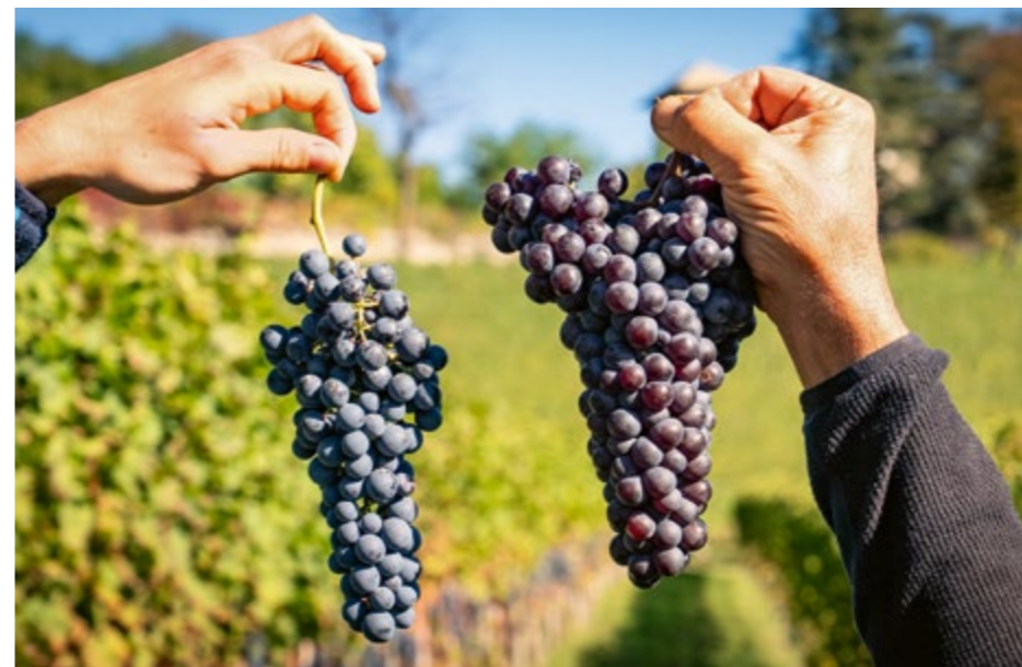
Grappoli di Nebbiolo Talin e Lampia a confronto