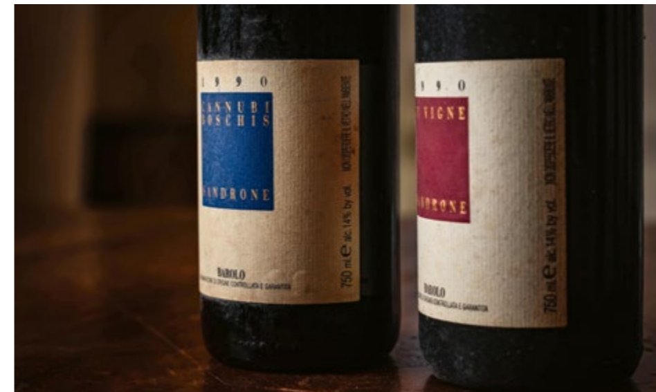
Il Barolo annata 1990 premiato da Robert Parker