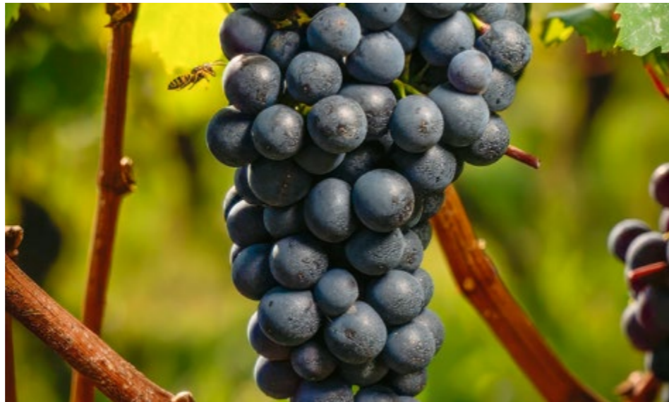
Grappoli di Dolcetto durante la vendemmia

L'uso dei grappoli di Dolcetto anche come uva da mensa ha contribuito a identificarlo come il vitigno della quotidianità, così come il suo impiego per la produzione di un particolare tipo di confettura, la cognà , prodotta con lunghe cotture del suo mosto in presenza di altri frutti stagionali come le pere Madernassa, le mele Cotogne, le nocciole Tonde e Gentili delle Langhe, le noci e i fichi di maturazione tardiva.