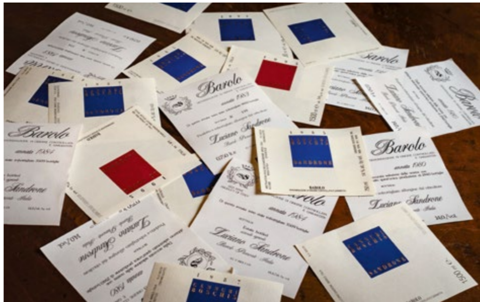
Etichette vecchie e nuove del Barolo Sandrone

"Ho sempre amato in modo particolare l'annata 1990 del Barolo. Non è stato il millesimo del mio esordio come produttore di vino, ma certamente è stata l'annata che per prima ha consacrato la grande qualità dei nostri vini. Me la ricordo bene