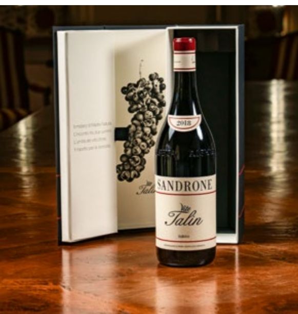
La splendida confezione del Barolo Vite Talin