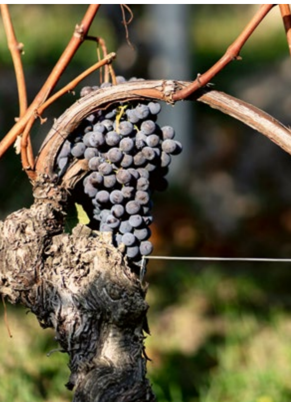
Splendido grappolo di Nebbiolo

altrove, è sulle colline di Langa e Roero che questo vitigno ha trovato i suoi spazi ottimali, come viene confermato dalle attuali superfici vitate: sui 9.500-10.000 ettari coltivati nel mondo intero quasi 6.000 ettari sono localizzati sulle colline albesi.