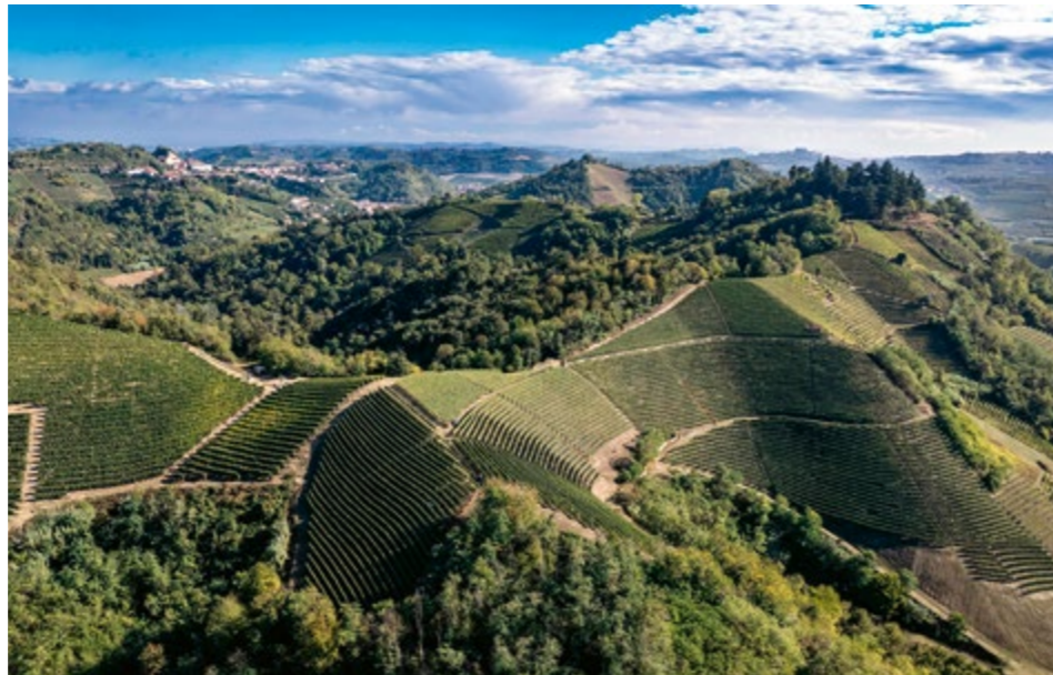
La collina di Valmaggione