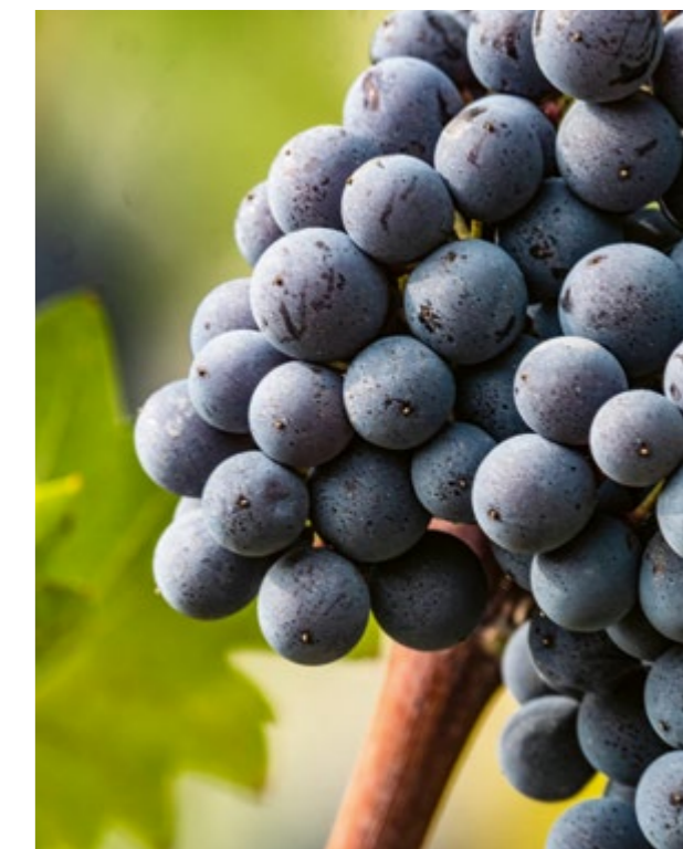
Particolare del grappolo di Nebbiolo Talin

Un ulteriore approfondimento si sta facendo grazie alla sinergia con il CREA – Consiglio per la Ricerca in Agricoltura e l’Economia Agraria, il principale Ente di ricerca italiano dedicato alle filiere agroalimentari con personalità giuridica di diritto pubblico, vigilato dal Ministero dell’agricoltura, della sovranità alimentare e delle foreste. Il progetto su cui si sta lavorando concerne la caratterizzazione aromatica dell’uva e del vino che da questa si produce.